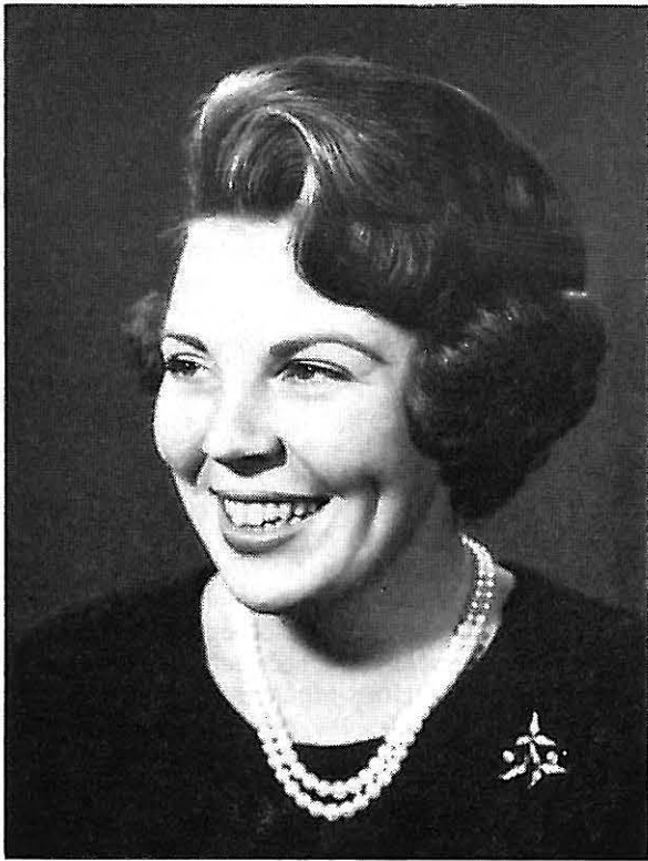
H. K. H. Prinses Beatrix

viert op 31 januari haar zesentwintigste verjaardag.