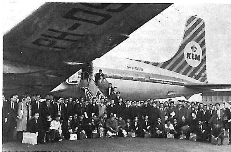
Aankomst crews „Straat Franklin” en „Straat Freetown” op Schiphol.