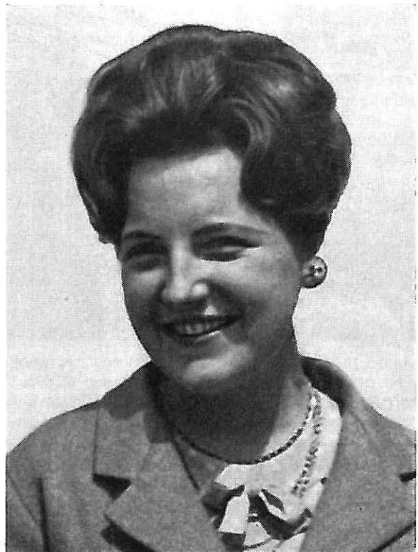
H. K. H. Prinses Margriet

het Petekind van de Nederlandse Koopvaardij, vierde op 19 januari haar eenentwintigste verjaardag.