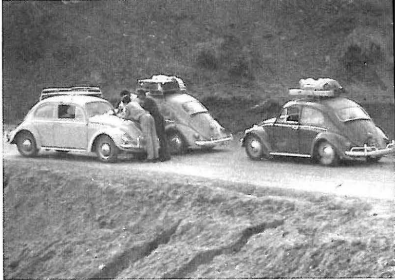
In Turkije. Quo vadis?

5 juli te Venetië waar ik de waarschijnlijk klassiek stomme vraag stelde hoe naar ons hotel te rijden. Lieten de V.W. achter in een z.g. autorissimo, een 14 verdiepingen hoge spiraalgarage en voeren verder naar ons hotel Triëste