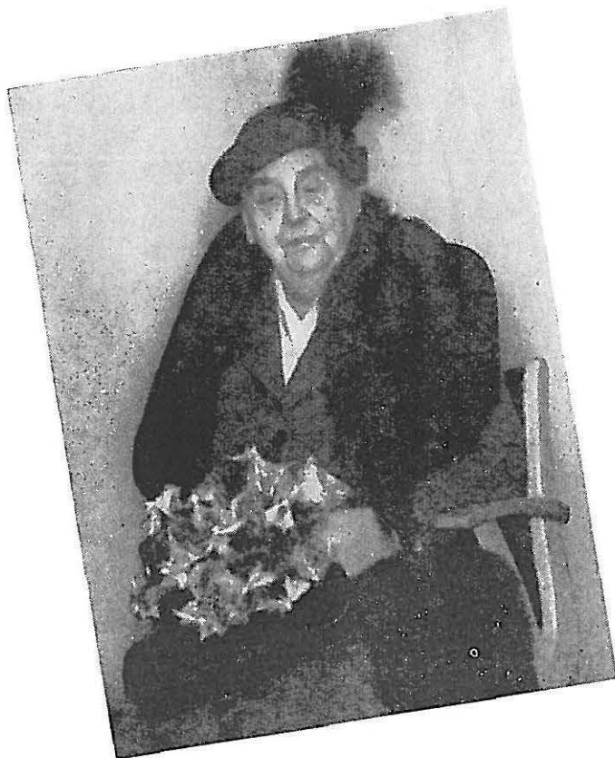
H.K.H. Prinses Wilhelmina hoopt op 31 augustus a.s. de 81-jarige leeftijd te be- reiken.