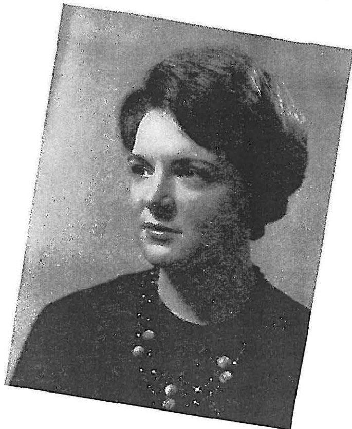
Op 5 augustus j.l. vierde H.K.H. Prinses Irene haar tweeëntwintigste verjaar- dag.