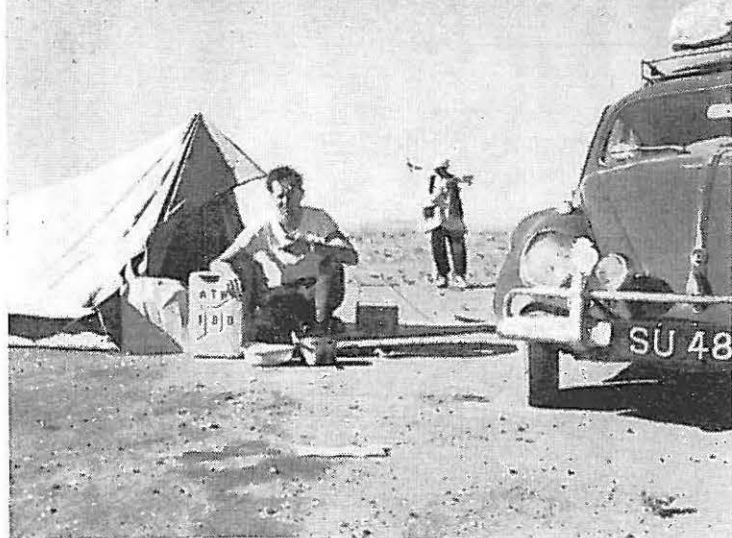
In de Perzische woestijn op weg naar Teheran.

Namen node afscheid en zaten na tien minuten weer in de woestijn op weg naar Meshed en Teheran, waar we twee juni aankwamen, daarmee het meest barre gedeelte van de reis achter ons hebbend (mijlen: 5527). Reden veel op 't kompas over een steenpad met wasbordprofiel niet harder dan 20 à 25 mijl, dagen achtereens zonder ooit iemand te ontmoeten. Benzinepompen waren schaars en we hadden zoveel mogelijk extra bij ons. Overdag brandend heet, de nachten fris. 'k Heb in deze dagen diepe bewondering voor ons vervoer gekregen op z'n tubeless banden. Enige malen moest de wagen uit het zand worden gegraven, waarbij onze vanuit Singapore meegenomen zandmatten hun dienst bewezen. In Meshed was weinig te beleven. Er staat de z.g. Gouden Moskee en 't is een pelgrimsplaats. Enige lieden met stokken maakten ons op weinig subtiële wijze duidelijk dat men niet van camera's hield. Vrij dicht bij Rusland zijnde, werd besloten eens een blik achter het gordijn te slaan. Na een dikke 100 mijl te hebben gereden over de wasbordhighway werden we door de Iraanse politie opgebracht en wilde een opgeblazen commissaris de gele kaart zien. Nou die hadden we niet, zelfs nooit van gehoord. Er vielen enige boze woorden en na elkaar gedreigd te hebben met consul en gevangenis zijn we weer naar Meshed teruggereden, en via Sabsawar en Semnan naar Teheran waar twee studenten die we de weg vroegen ons een goed hotelletje bezorgden en het