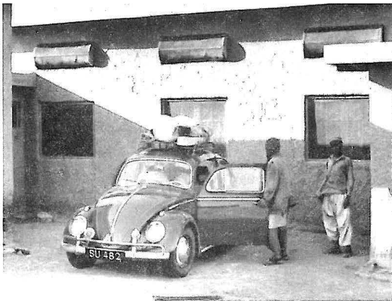
De „herberg” te Nukkundi, rechts de door zand geplaaide kok.

wekte begeleiding van Radio Ceylon bij deze zaken. Vertrokken in de vroege over een miserabel bergpad en alleen op de wereld naar 't scheen. Een ideale plaats voor overvallen. De enkele schaapherders die hier rondwalen zijn dan ook voorzien van een geweer. Plotseling kwam er een in zicht om een hoek. De man stak zijn hand op, mogelijk dorst hebbend of groetend, maar onze argwanende breinen versleten hem onmiddellijk voor een struikrover, meteen werd vol vooruit gegeven en 't individu in een dichte stofwolk gepasseerd, bijna ongelukken makend. 's Middags kwamen we bij een gehucht met een door rotsblokken omringde politiepost compleet met mitrailleurtorens en een ketting over de weg gespannen. Men bleef binnen de veste en na eens vriendelijk naar ze gewuifd te hebben zou ik de ketting even weghalen. Als reactie daarop werd een mitrailleur op ons gericht en verschenen enige geweerlopen. We zijn toen maar uitgestapt en naar ze toe gewandeld. Werden vijandig ontvangen en na diverse talen geprobeerd te heb-