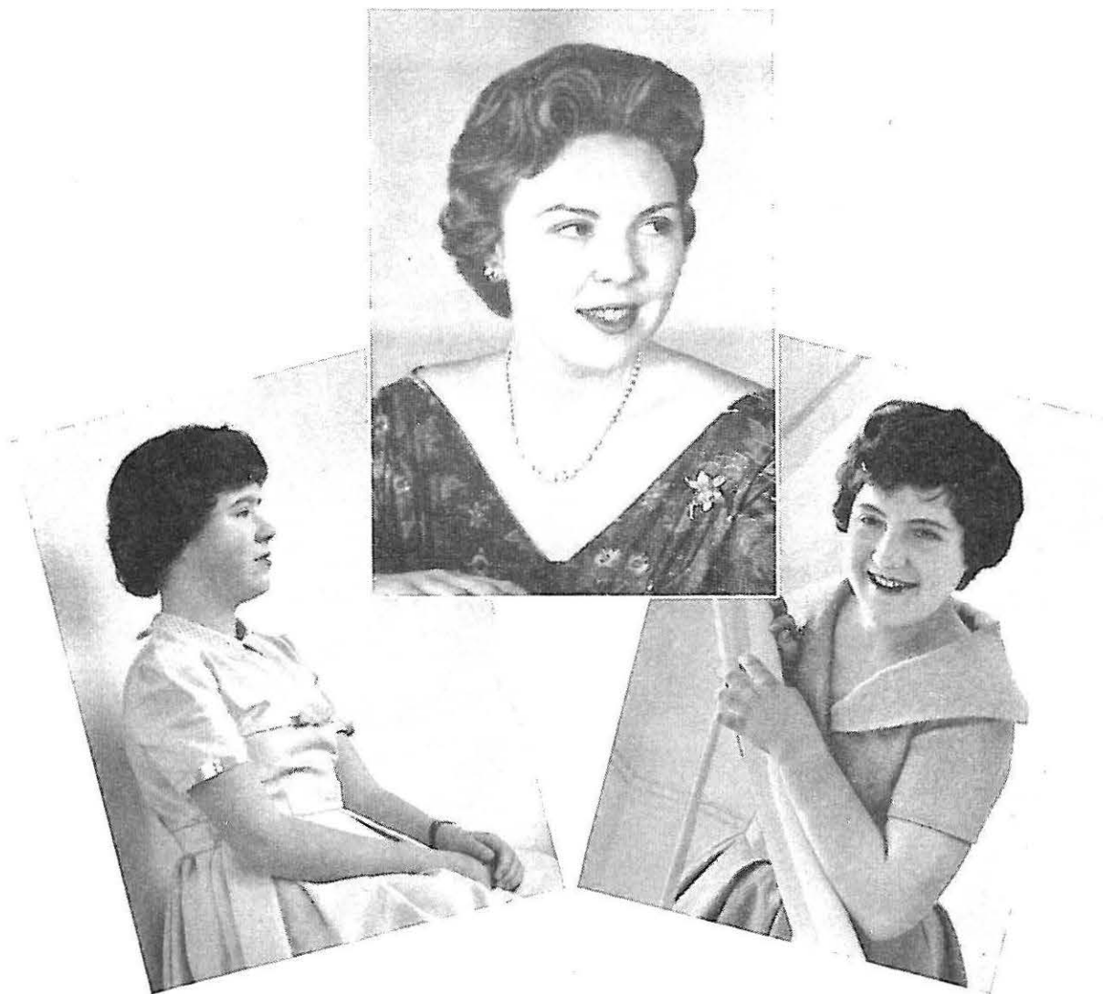
Op 18 februari a.s. hoopt H. K. H. Prinses Marijke haar veertiende verjaardag te vieren.