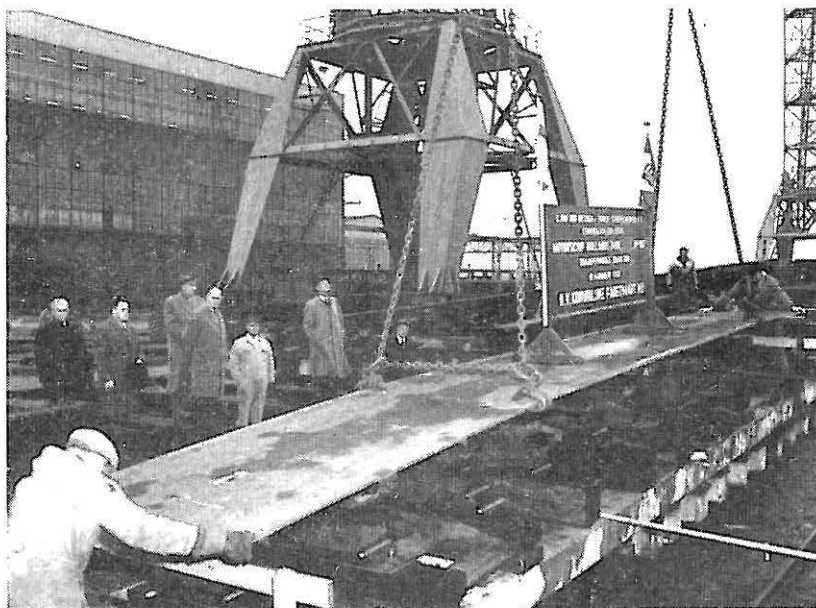
De kiellegging van het m.s. „Hollands Duin” vond op 23 januari jl. plaats bij C. van der Giessen & Zonen's Scheepswerven N.V. te Krimpen aan den IJssel.

In ons oktober-nummer werd vermeld, dat de twee door de K.P.M. bestelde schepen voor de algemene vrachtvaart „Hollands Diep” en „Hollands Duin” zullen heten. Ook voor laatstgenoemd schip werd inmiddels de kiel gelegd.