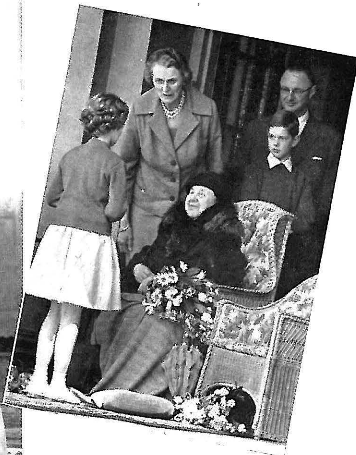
H.K.H. Prinses Wilhelmina hoopt op 31 augustus a.s. de tachtig-jarige leeftijd te bereiken. Eén van de laatste opnamen: H.K.H. neemt op Paleis Het Loo ter gelegenheid van de bevrijdingsfeesten in mei 1960 de hartelijke hulde van de jeugd in ontvangst.