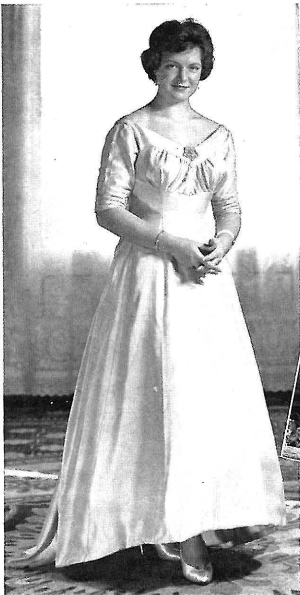
Een recente opname van H.K.H. Prinses Irene, die op 5 augustus haar eenentwintigste verjaardag vierde.