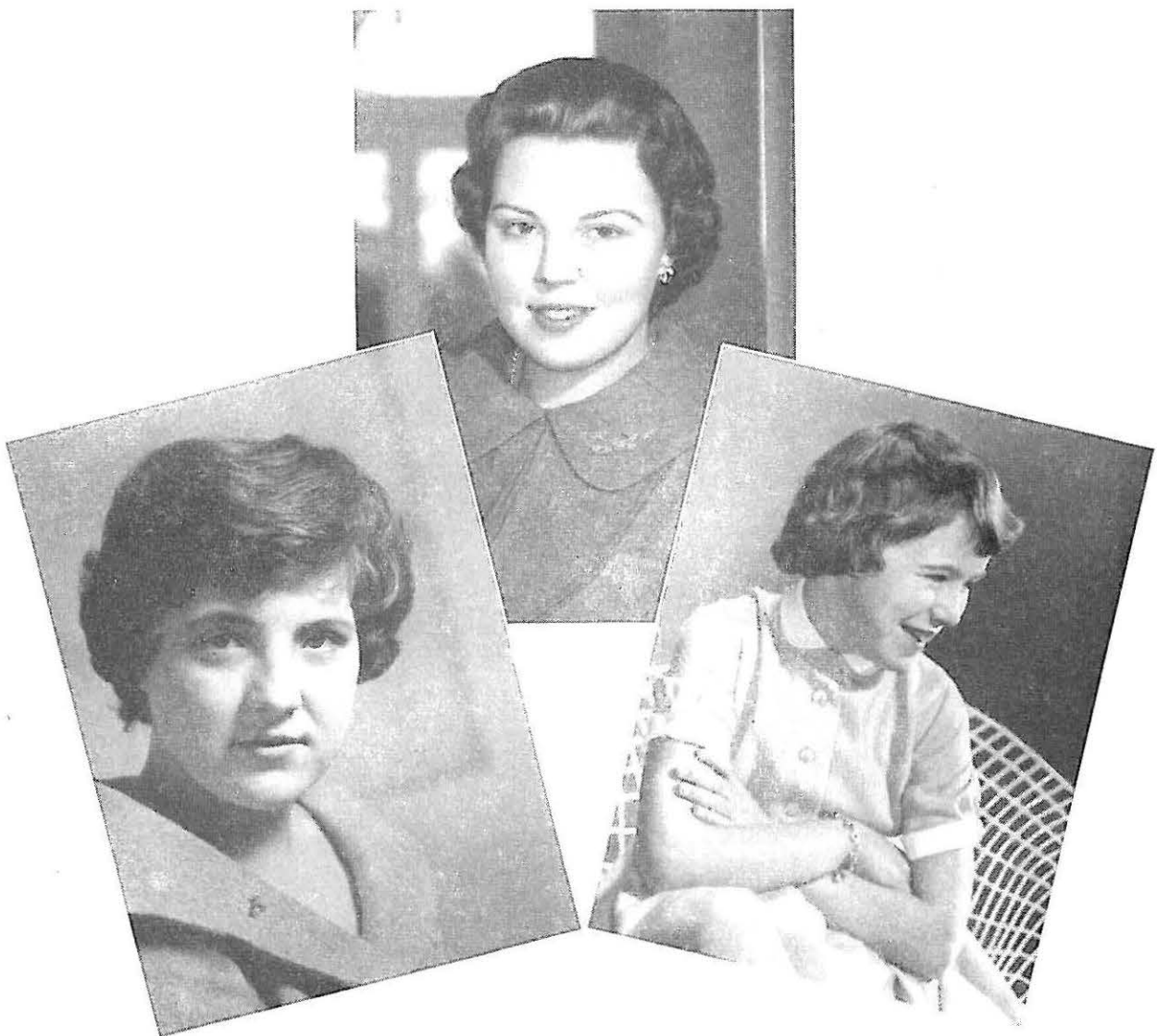
H.K.H. Prinses Margriet, het Petekind van de Nederlandse Koopvaardij, vierde op 19 januari j.l. haar zeventiende verjaardag.