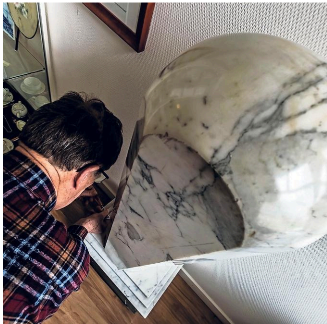
Bovenaanzicht van de marmeren zuil.