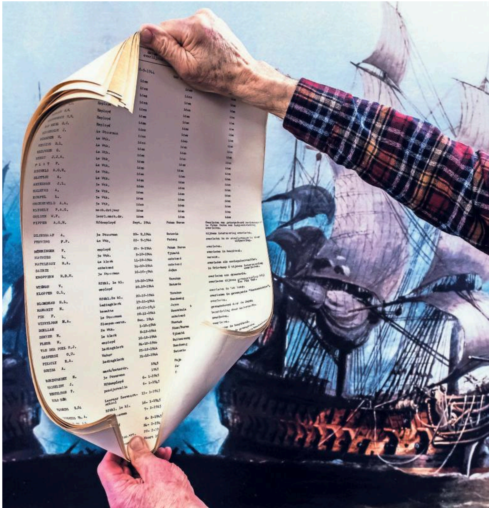
De koker in het marmeren oorlogsmonument bevat een dik pak papieren met namen van gevallenen.

Nieuwe podcast vertelt het verhaal achter het oorlogsmonument in Museum Prins Hendrik de Zeevaarder in Egmond aan Zee