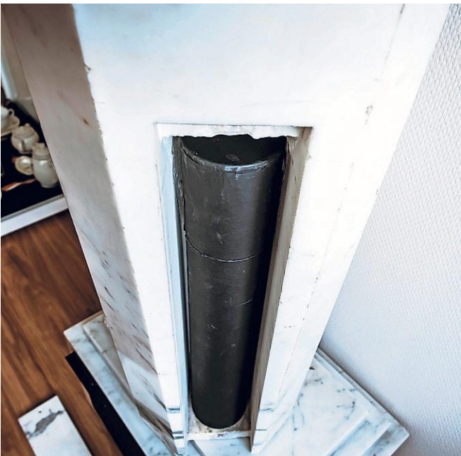
Achter een plaat aan de achterkant van de zuil zit de koker.