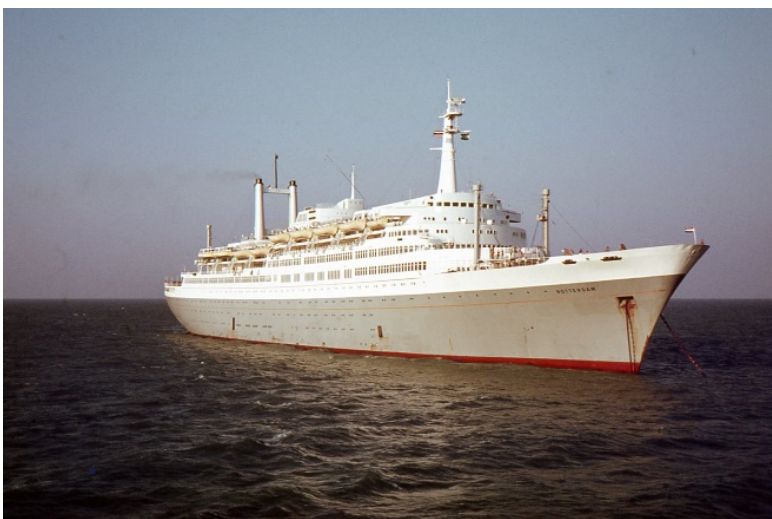
SS Rotterdam november 1966 voor anker bij Bangkok pilot station

Met een beetje geluk zijn we deze reis echter met kerst in Sydney. Het is daar dan hoogzomer en dan ziet de wereld er ineens veel positiever uit. Als vrijgezel is dit een prachttijd, maar zodra je verliefd wordt, is dat anders.