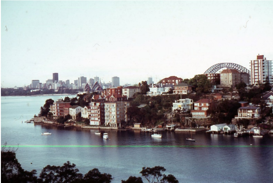
Uitzicht over Sydney Bay van af de flat van Robynne