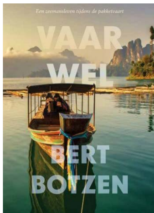
Vaar Wel **8) Een zeemansleven tijdens de pakketvaart ISBN: 978-94-638-947-5