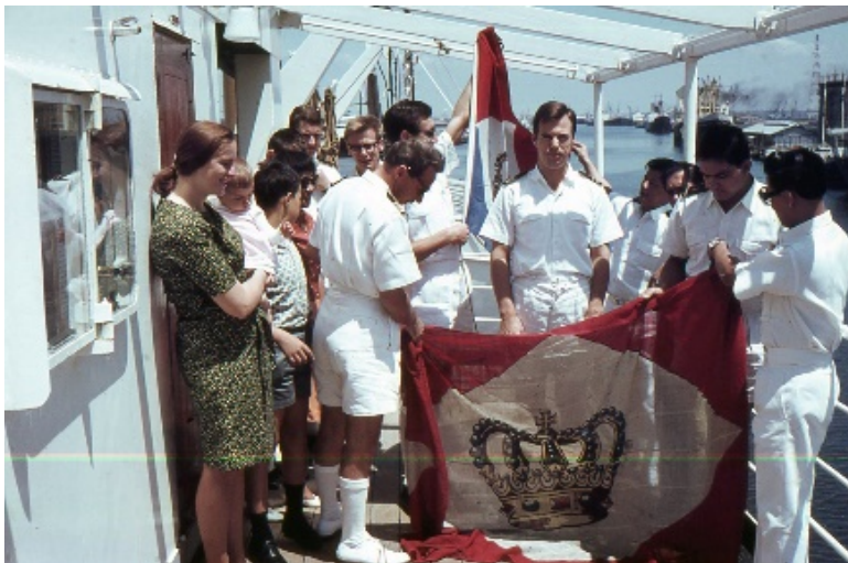
Het op 1 januari 1967 strijken van de KPM-vlag en hijsen van de KJCPL-vlag

Op 1 januari 1967 lagen wij in Melbourne, streken daar voor het laatst de KPM-vlag en hesen de vlag van de KJCPL (RIL). Dochter KJCPL nam daarbij Moeder KPN over. Alle officieren kwamen automatisch in dienst van de KJCPL. Vandaag kregen wij het bericht dat op MS Straat Malakka (RIL), de gezagvoerder vier muitende Chinezen door de benen moest schieten, om ze op afstand te houden. Ik ben naar een oogarts geweest, omdat ik vaak hoofdpijn kreeg tijdens het studeren en lezen, maar wel alles volkomen scherp zie. Als ik het goed heb begrepen zijn mijn lenzen niet overal 100% rond of zoiets. Een leesbril koste me toen A$ 16,50 = Fl. 66,- (vond ik duur), maar ik heb nu geen last meer van hoofdpijn.