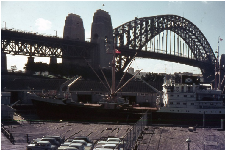
MS Van Neck aan kade naast Sydney Harbour Bridge

toen maar afgesproken te wachten tot we terug zouden zijn. (Sydney -> Melbourne ->, Tasmania -> Sydney duurde totaal ongeveer drie weken). Dit met de afspraak elkaar niet te schrijven, behalve als levensteken een kaartje.